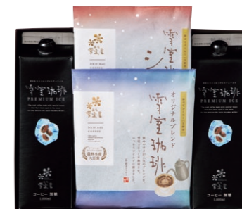
EYLD-310 雪室珈琲 PREMIUM ICE&DRIP ¥3,348 (税込)

雪室珈琲プレミアムアイスコーヒー 1,000ml×2 本 雪室珈琲オリジナルブレンドドリップバッグ 10g×5P×1 袋 雪室珈琲ショコラドリップバッグ 10g×5P×1 袋