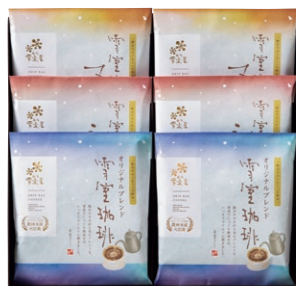
EYAD-410 雪室珈琲 ASSORT 30 PIECES ¥4,428 (税込)

雪室珈琲オリジナルブレンドドリップバッグ 10g×5P×2 袋 雪室珈琲ショコラドリップバッグ 10g×5P×2 袋 雪室珈琲マイルドドリップバッグ 10g×5P×2 袋