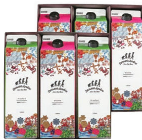
DLL-30 DL ICED TEA 6 ¥3,240 (税込)

Darwin's London アイスティーオリジナル 1000ml×3本 Darwin's London アイスティーアールグレイ 1000ml×3本