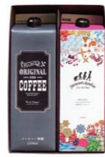
SCDL-10 ICED COFFEE & ICED TEA 2 ¥1,080 (税込)

オリジナルアイスコーヒー 1000ml×1本 Darwin's London アイスティーオリジナル 1000ml×1本