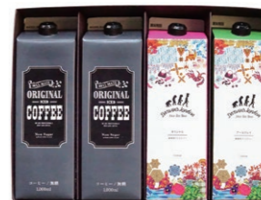
SCDL-20 ICED COFFEE & ICED TEA 4 ¥2,160 (税込)

オリジナルアイスコーヒー 1000ml×2本 Darwin's London アイスティーオリジナル 1000ml×1本 Darwin's London アイスティーアールグレイ 1000ml×1本