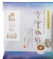
ドリップバッグコーヒー