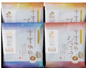
EYAD-280 雪室珈琲 ASSORT 20 PIECES ¥3,024 (税込)

雪室珈琲オリジナルブレンドドリップバッグ 10g×5P×1 袋 雪室珈琲ショコラドリップバッグ 10g×5P×1 袋 雪室珈琲マイルドドリップバッグ 10g×5P×2 袋