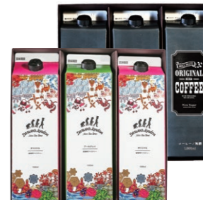
SCDL-30 ICED COFFEE & ICED TEA 6 ¥3,240 (税込)

オリジナルアイスコーヒー 1000ml×3本 Darwin's London アイスティーオリジナル 1000ml×2本 Darwin's London アイスティーアールグレイ 1000ml×1本