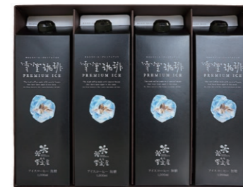
EYL-32 雪室珈琲 PREMIUM ICE LIQUID 4 ¥3,456 (税込)