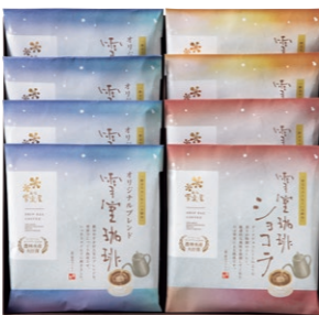
カタログ限定 EYAD-540 雪室珈琲 ASSORT 40 PIECES ¥5,832 (税込)

雪室珈琲オリジナルブレンドドリップバッグ 10g×5P×4 袋 雪室珈琲ショコラドリップバッグ 10g×5P×2 袋 雪室珈琲マイルドドリップバッグ 10g×5P×2 袋