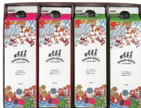
DLL-20 DL ICED TEA 4 ¥2,160 (税込)

Darwin's London アイスティーオリジナル 1000ml×1本 Darwin's London アイスティーアールグレイ 1000ml×1本