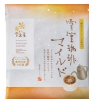
ドリップバッグコーヒー