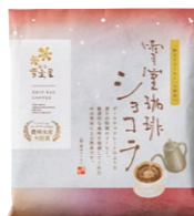
ドリップバッグコーヒー