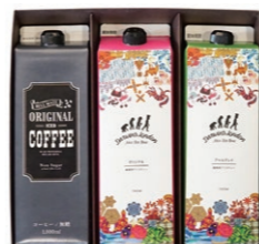
SCDL-15 ICED COFFEE & ICED TEA 3 ¥1,620 (税込)

オリジナルアイスコーヒー 1000ml×1本 Darwin's London アイスティーオリジナル 1000ml×1本 Darwin's London アイスティーアールグレイ 1000ml×1本