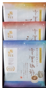
EYD-215 雪室珈琲 DRIP SET 15 PIECES ¥2,322 (税込)

雪室珈琲オリジナルブレンドドリップバッグ 10g×5P×1 袋 雪室珈琲ショコラドリップバッグ 10g×5P×1 袋 雪室珈琲マイルドドリップバッグ 10g×5P×1 袋