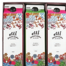
DLL-15 DL ICED TEA 3 ¥1,620 (税込)

Darwin's London アイスティーオリジナル 1000ml×2本 Darwin's London アイスティーアールグレイ 1000ml×1本