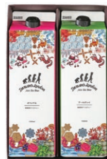
DLL-10 DL ICED TEA 2 ¥1,080 (税込)

アイスコーヒーと「Darwin's London」のアイスティーを 一緒にしたギフトセットです。 ※ギフト箱は変更になる場合がございます。