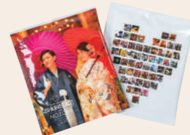
結婚式やパーティの 引出物にプラス