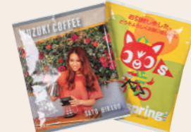
営業ツールの一環に 味わう楽しさをプラス