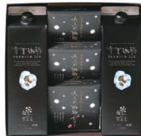
EYLZ-24 (#40070) 雪室珈琲 PREMIUM ICE LIQUID & 雪室珈琲ゼリー ¥2,400 (税抜) 雪室プレミアムアイスコーヒー 1,000ml×2本 雪室コーヒーゼリー ×3個