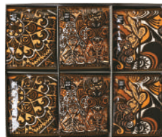
TDB-38 (#40166) TRIP DRIP "BALI" 24 PIECES ¥3,800 (税抜)