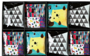
TDH-50 (#40170) TRIP DRIP "北歐" 32 PIECES ¥5,000 (税抜)