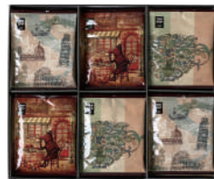
TDI-38 (#40168) TRIP DRIP "ITALY" 24 PIECES ¥3,800 (税抜)