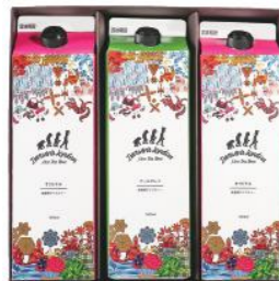
DLL-15 (#40322) DL ICED TEA 3