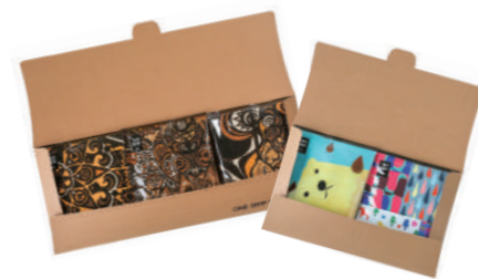
DBP-5 (#40161) / DBP-3 (#40162) DRIP BAG PETIT (3P/2P)

ノベルティやちょっとしたプチギフトに最適！ 2個タイプ、3個タイプをご用意しております。