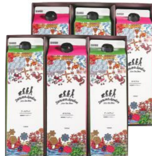
DLL-30 (#40324) DL ICED TEA 6