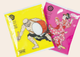
ノベルティグッズとして お客様に配布可能