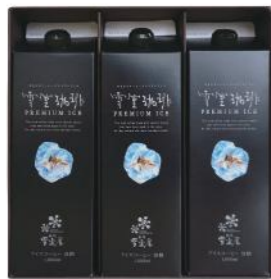
EYL-24 (#40055) 雪室珈琲 PREMIUM ICE LIQUID 3 ¥2,400 (税抜) 雪室プレミアムアイスコーヒー 1,000ml×3本

雪室で熟成することでよりまろやかになった珈琲豆を贅沢に使い、 こだわりのエスプレッソ抽出で美味しさをギュッと閉じ込めました。 極めて濃厚でコク深いタイプのアイスコーヒーです。