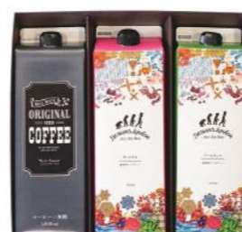
SCDL-15 (#40332) ICED COFFEE & ICED TEA 3