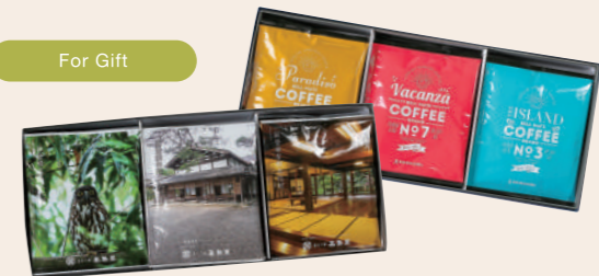
お客様のオリジナルのギフトが 小ロットで簡単に作れます