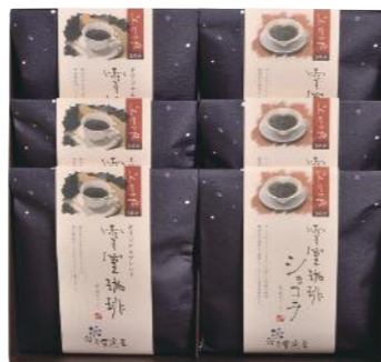
EYD-38 (#40047) 雪室珈琲 DRIP SET 30 PIECES

雪室珈琲ドリッパー 10g×5P×2 袋 雪室ショコラドリッパー 10g×5P×2 袋