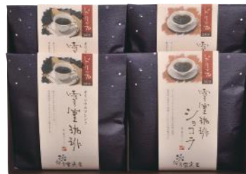
EYD-26 (#40046) 雪室珈琲 DRIP SET 20 PIECES

厳選されたコーヒー豆を天然雪を活用した食品保蔵庫「雪室」でゆっくり寝かせ、 雑味と苦味の角がとれたまろやかな味わいに仕上げました。