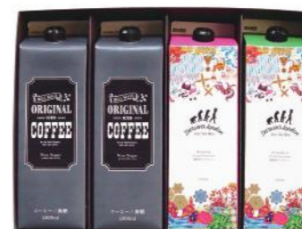
SCDL-20 (#40333) ICED COFFEE & ICED TEA 4