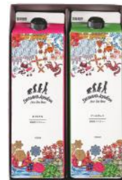
DLL-10 (#40321) DL ICED TEA 2