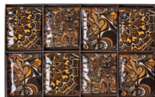
TDB-50 (#40169) TRIP DRIP "BALI" 32 PIECES ¥5,000 (税抜)