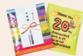
周年行事や祝い事に 最適な記念品として