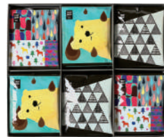
TDH-38 (#40167) TRIP DRIP "北歐" 24 PIECES ¥3,800 (税抜)