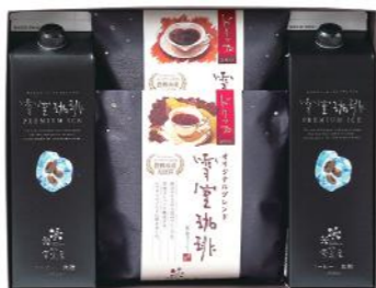
EYLD-30 (#40057) 雪室珈琲 PREMIUM ICE&DRIP

雪室珈琲×150g(粉) 雪室ショコラ×150g(粉) 雪室クラシック×150g(粉)