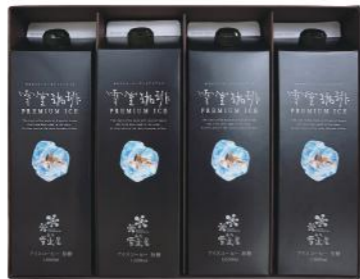
EYL-32 (#40056) 雪室珈琲 PREMIUM ICE LIQUID 4 ¥3,200 (税抜) 雪室プレミアムアイスコーヒー 1,000ml×4本