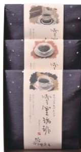
EYR-30 (#40048) 雪室珈琲 SET REGULAR

雪室珈琲ドリッパー 10g×5P×3 袋 雪室ショコラドリッパー 10g×5P×3 袋