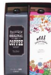
SCDL-10 (#40331) ICED COFFEE & ICED TEA 2

「Darwin's London」のアイスティーと アイスコーヒーを一緒にしたギフトセットです。