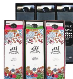
SCDL-30 (#40334) ICED COFFEE & ICED TEA 6