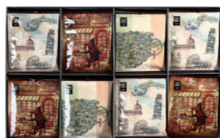
TDI-50 (#40171) TRIP DRIP "ITALY" 32 PIECES ¥5,000 (税抜)