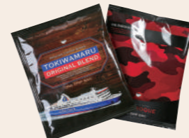
独自の販売商品として PB を展開可能