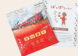
サークルや仲間うちでの 記念グッズとして