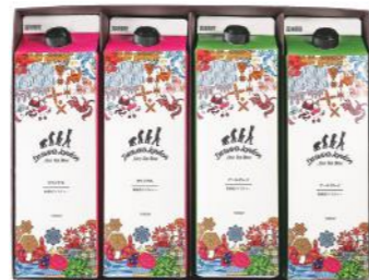
DLL-20 (#40323) DL ICED TEA 4